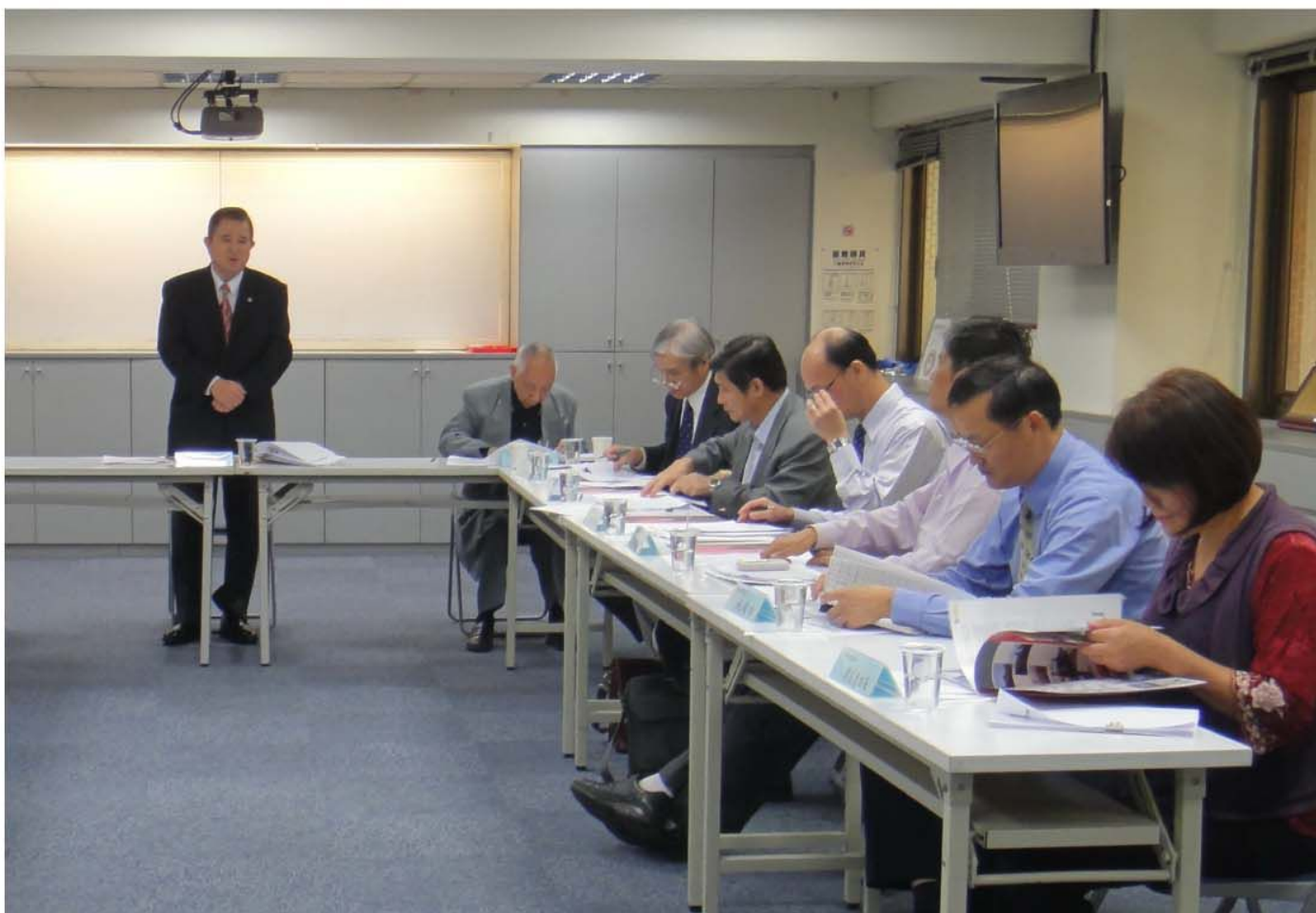
優良保全人員選拔共推薦 45 位候選人，並由產（各公會理事長）、官（主管機關）及學（學術界）等專業領域的 15 位評審，投票選出 10 位傑出保全人員。

理事長同時擔憂保全公司雖然用心守護安全之門，並設下層層關卡過濾篩選保全人員，但是有些雇主還是一意孤行聘請沒有通過認證的保全人員。某些人員或許有犯罪前科紀錄，但還是有相當多的社區大樓聘雇沒有通過警察機關查核認證的「保全人員」。王振生指出，很多大樓聘雇的保全人員，是由雇主透過人力派遣公司管道尋找員工前來充當保全人員，所以這些保全人員並沒有獲得合法的驗證，並且不受《保全業法》的規範，因此雇主及該社區住戶也無法受到合法的保障。