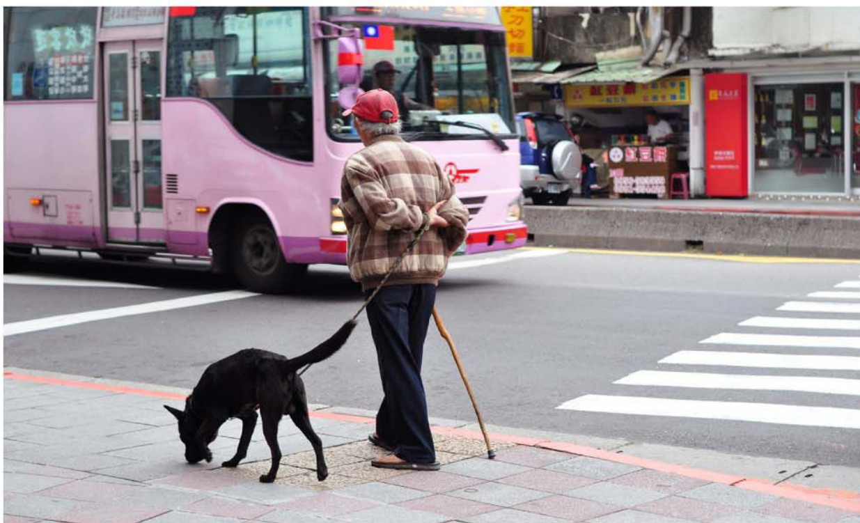
台灣社會日漸少子化，未來平均每位成人需扶養6位老人，為因應高齡化社會來臨，政府打造適合銀髮族生活的安全環境已刻不容緩。