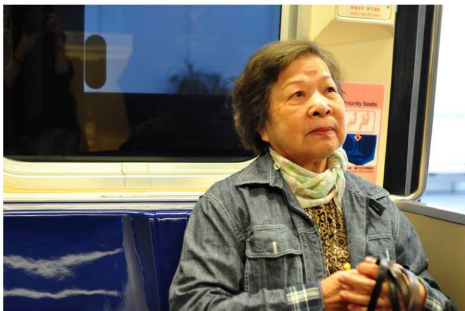
生活環境的改變增加了銀髮族適應新環境的困擾，政府需針對長照醫療及長照保險議題，加強與銀髮族、各界專家學者及保全產業交流，才能具體照護銀髮族羣。

照保險，不要搖擺不定。政府需重視銀髮族長照需求，並針對長照醫療及長照保險議題，加強與銀髮族、各界專家及學者討論，才能正確做出具體決策。