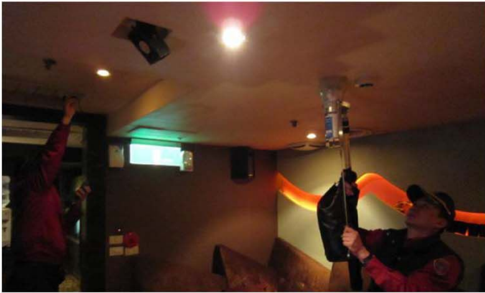
公共場所人口出入密集，背後隱藏著消防安全的重大隱憂，因此作好定期消防安全檢查，才能確保民眾生命財產安全。

車禍救助，甚至是有人在家受困，自然災害發生搶救…等等；緊急救護，如有人受傷需緊急送往醫院救護。