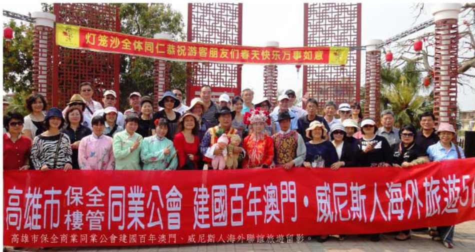
高雄市保全商業同業公會建國百年澳門·威尼斯人海外聯誼旅遊留影。

不僅熟悉行業法規、瞭解保全體系如何運作外，還包括各種危機處理方法及突發狀況的應對能力，以確保提供安全服務品質。職前訓練結束前，新進保全人員必須通過各科目的測試才能獲得保全護照，依法擁有保全護照的人，才得以從事保全工作。