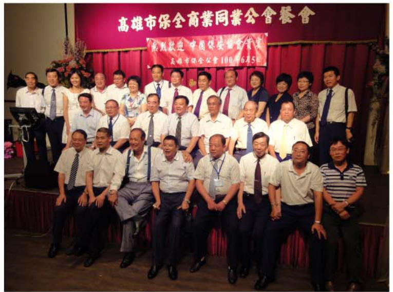
中國保安協會與高雄市保全商業同業公會理監事合影。

主，因此市場較小。隨著當地保全公司數量的增長，同業之間的競爭越演越烈，最終發展成惡性的削價競爭。目前，公會對於價格競爭問題主要是透過居中協商、溝通解決，並且希望日後能夠提出更有效的方案，務求維持高雄市保全行業的市場良好秩序。