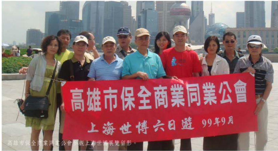
高雄市保全商業同業公會參觀上海世博展覽留影。