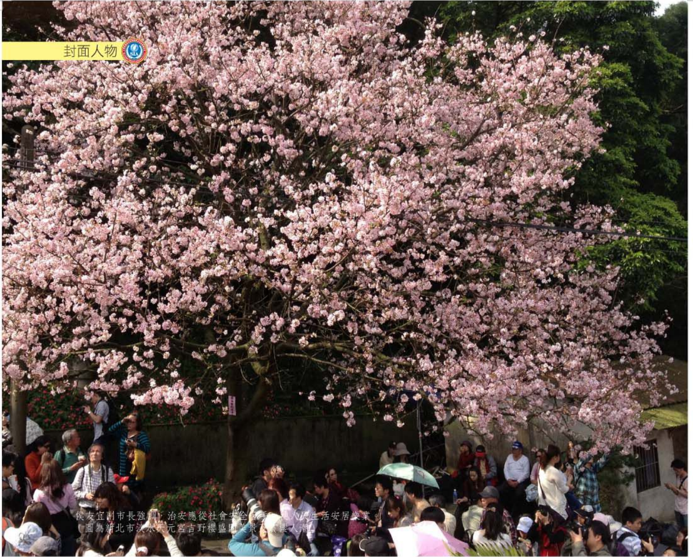
侯友宜副市長強調：治安應從社會安全著手，「取生活安居樂業」 （圖為新北市淡水天元宮吉野櫻盛開美景，攝於侯友宜副市長）