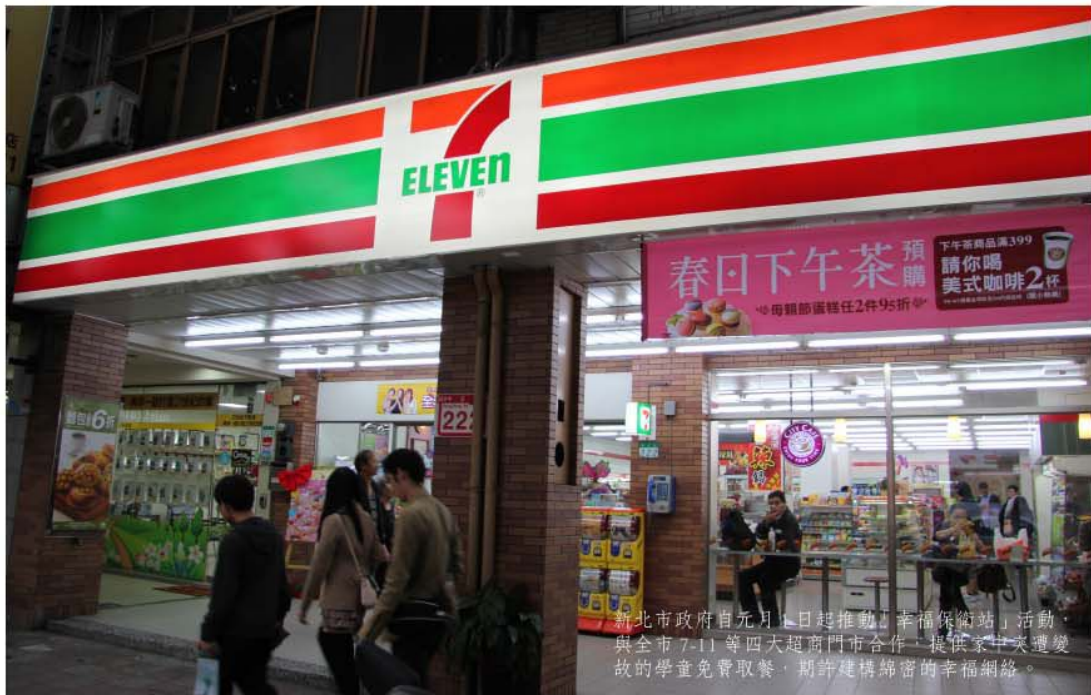
新北市政府自元月1日起推動「幸福保衛站」活動，與全市 7-11 等四大超商門市合作，提供家中突遭變故的學童免費取餐，期許建構綿密的幸福網絡。

業，「便能夠帶給產業經驗和人脈，促使警民密切合作」。但礙於現行「公務人員旋轉門條款」【註一】，公務員於離職後三年內，不得擔任與其離職前五年內之職務相關的工作，退休員警投入保全產業因而受限，對此，侯友宜疾呼：「修法現在就要做，不能等待未來」。