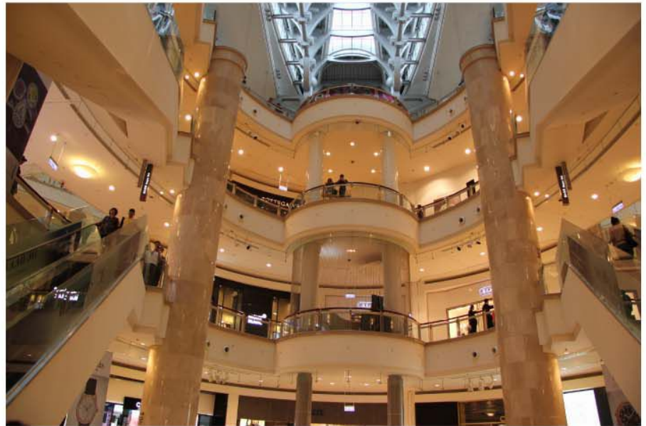
臺北市高樓層建築防災中心執勤人員通常由保全業者擔任，他們須接受專業訓練才能確保火災發生的第一時間就能及時有效的做好危機處理。

夠了嗎？答案當然是否定的，火災發生與每個人都有密切關係，普通民眾應該積極地學習火災的防護知識，當然，與住戶聯繫最緊密的保全業也同樣處在至關重要的位置上。臺灣目前住宅火災的比例占總火災比例的四、五成左右，而住宅火災的傷亡比例也略高於其他火災事故，住宅火災的預防與救助不可忽視。