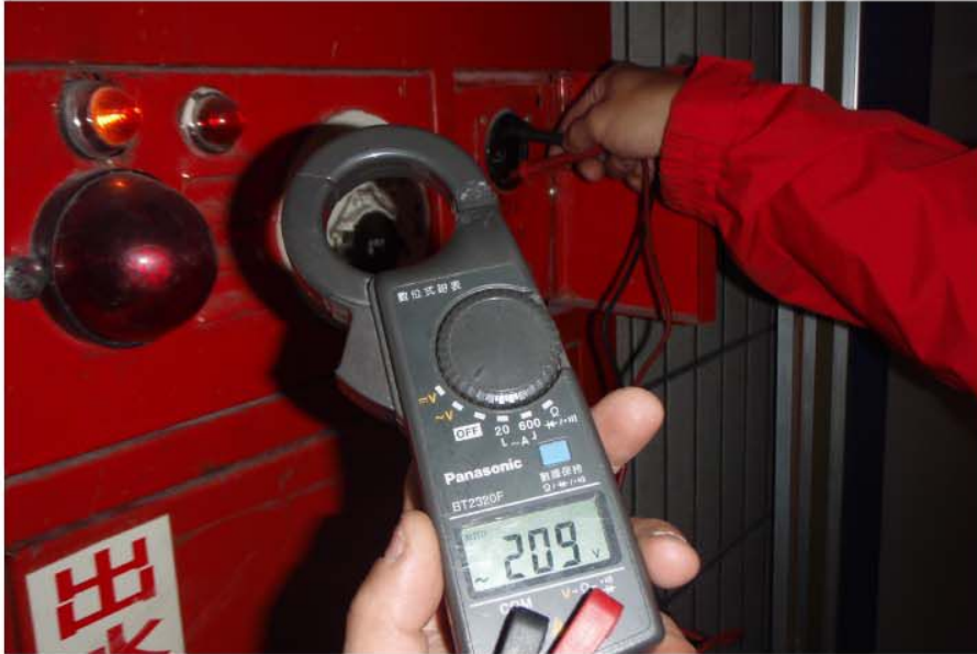
消防安全重要性不容小覷，因此任何防災警報設備都必需謹慎維護。