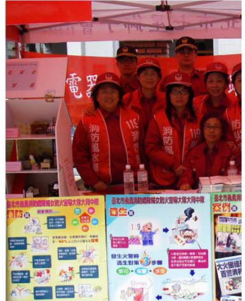
臺北市政府消防局消防風水師暨婦女防火宣導團隊以主動防災代替被動救災，免費到府實施防火、防災安全訪視，提昇居家消防安全。

及既往的特性，也就是說新設定的法律只適用在這個法律設定之後新建的場所或是建築物，對之前的場所不能強制要求符合現在的法律，像台南市北門醫院的事故，它的消防設備是符合當時的法規，但卻並不符合現在的法規，這就使它存在著一定的火災隱患，但由於法律覆蓋不到，政府部門在執法管理上就遇到了很大的困難。一個場所所有消防安全設備，並不代表這個場所就一定是安全的。場所安全包括硬體和軟體兩方面，因此在硬體上不能強制保證的時候，消防部門就只能通過強化軟體即完善防火管理制度，儘量避免事故的發生或是做到能夠在火災發生後儘早將其撲滅。