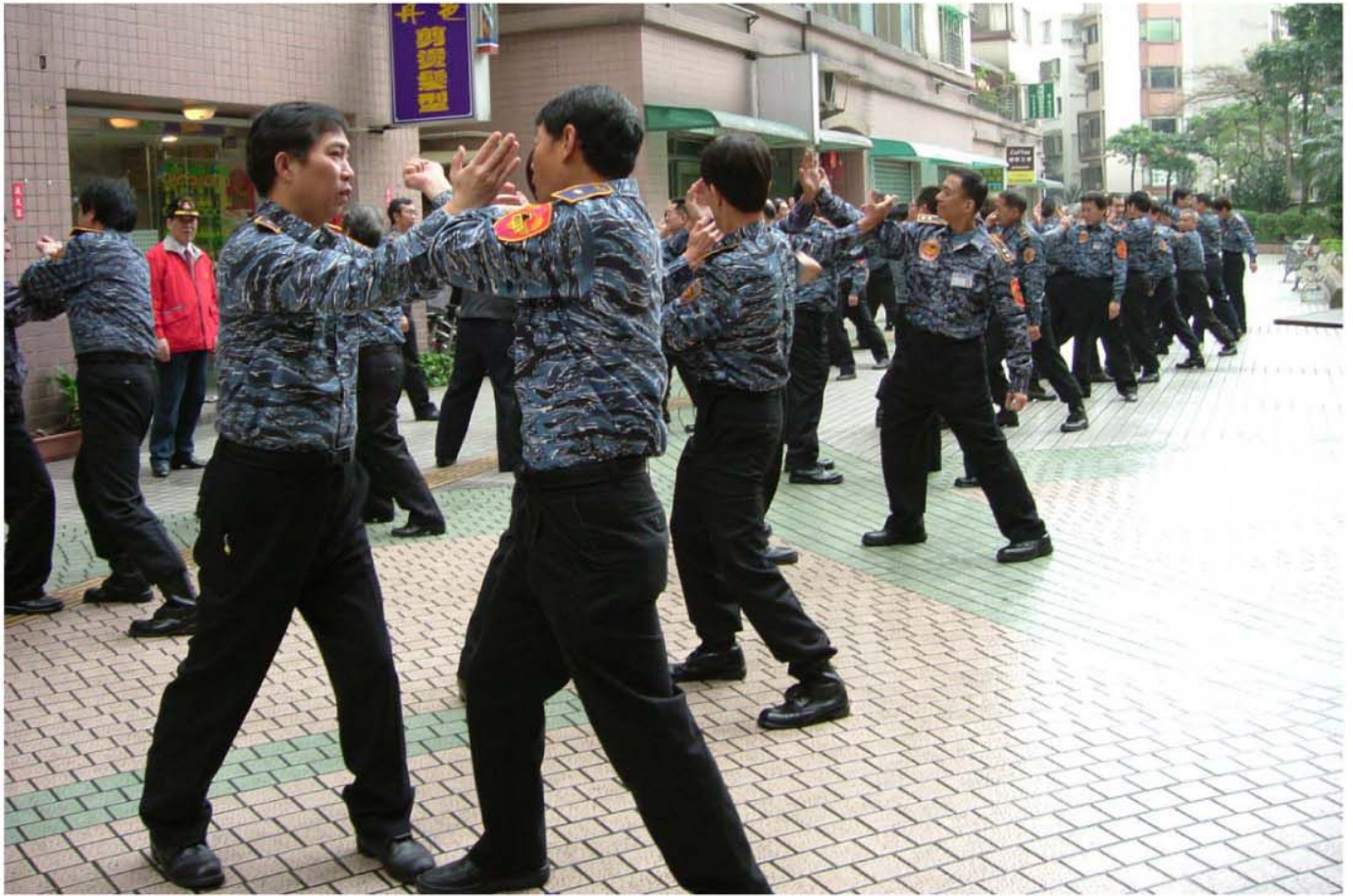
保全人員肩負社會治安重責，保全公司平常即定期舉辦教育課程計劃，並透過精良的專業訓練，協助維持社會安寧。

面鼓舞全國保全人員，另一方面則是向社會舉薦有品質、有口碑保證的人選，以提升保全人員的專業形象。代表學術界的鄭善印表示在人類社會中，每一個人最基本的需求就是安全。若沒有安全，人類將陷入恐慌，因此保全人員肩負了 1/2 的社會治安責任。